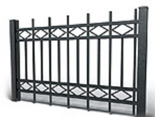
Ploty a brány

Naše firma a výrobky jsou zaregistrovány v programu ZELENÁ ÚSPORÁM. Zdarma nezávazné zaměření a konzultace na místě stavby.